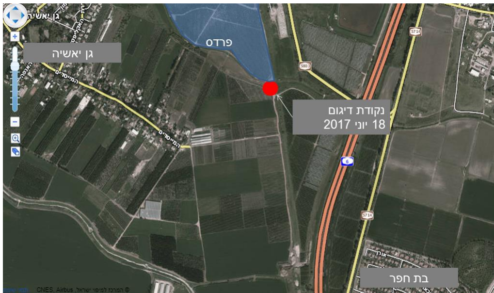
איור 5 : מיקום נקודת הדיגום בפרדס בת חפר