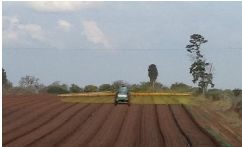
איור 6 : ריסוס במפוח על גבי טרקטור בשדה גזר סמוך לאליכין, דיגום 17 אוגוסט 2016