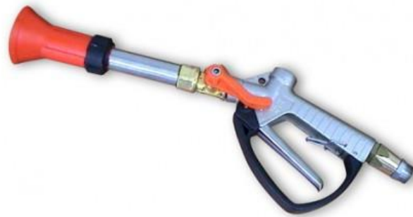
איור 7 : רובה ריסוס ידני

הריסוס ברובים הינו מדויק יותר, ויש בו פחות רחף. עם זאת מדובר בממשק ריסוס עתיר כח אדם, שישים רק בשטחים קטנים יחסית. בלתי אפשרי ליישם אותו במשקים גדולים של גידולי שדה, ירקות או מטעים גדולים.