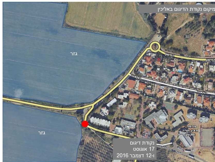
איור 4 : מיקום נקודת הדיגום באליכין

בת חפר (גובה 57 מ' מעל פני הים) הינה ישוב קהילתי שבה כ-5,448 תושבים, השוכנת במזרח עמק חפר, בין קיבוץ יד חנה וכביש 6 ממערב, קיבוץ בחן מצפון, נחל שכם מדרום וגדר ההפרדה שלאורך תוואי הקו הירוק ממזרח. היישוב הוקם ב-1995. הדגימה נערכה בסמוך לפרדס הממוקם בין בת חפר למושב גן יאשיה. תחנות המטאורולוגיות הסמוכות ביותר הן קיבוץ המעפיל (תחנה של איגוד ערים חדרה) ומדרשת רופין (תחנה של משרד החקלאות). בפרדס הסמוך לבת חפר נערכה בדיקה אחת. מיקום מכשיר הבדיקה מסומן באיור הבא. המיקום נבחר בהתאם לאזור שרוסס על ידי החקלאי ביום הדיגום.